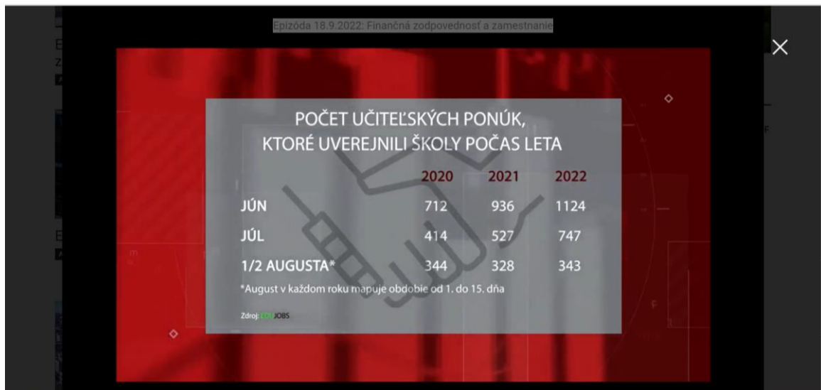
Obrázok 2 Dopyt po zamestnancoch v odvetvi