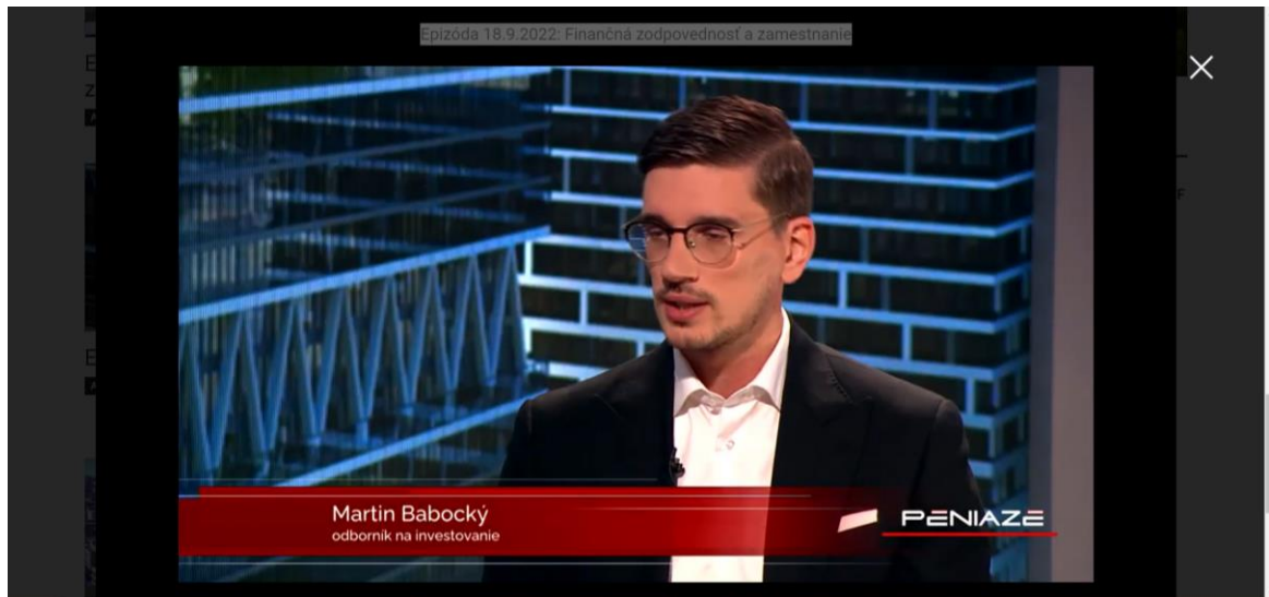
Obrázok 4 Investovanie do dlhopisov

Sledovanie rebríčkov úspešných ako nástroj motivácie. https://www.forbes.sk/ Magazín Forbes, ktorý prináša témy z oblasti financií.