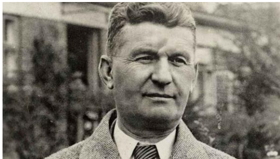
Obrázok 1 Tomáš Baťa