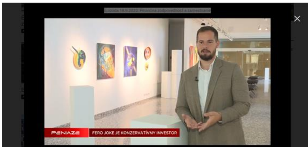
Obrázok 3 Hodnoty influenzera Fra Joke